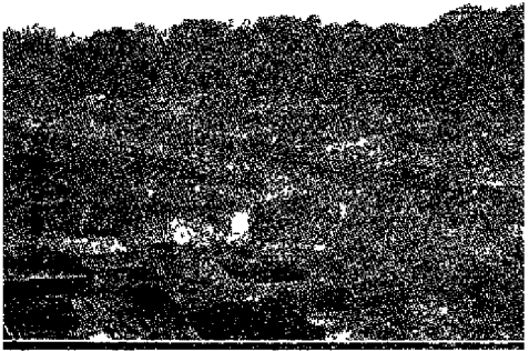
मूंगेर का शॉपड़ा बाजार